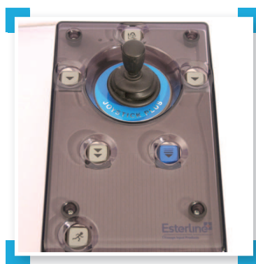
Traxsys Joystick Plus

Een joystick is een soort stuurknuppel. Als je de knuppel beweegt, beweegt ook de muiscursor op het computerscherm. Daarnaast zijn er een aantal knoppen aanwezig die de verschillende muisfuncties kunnen uitvoeren. De knoppen staan meestal vrij ver van de knuppel af, soms zijn ze zelf afgeschermd door een rooster. Hierdoor vermijd je ongewenste kliks. Er bestaan heel wat verschillende soorten joysticks: zeer robuuste exemplaren, joysticks die je bedient met extreem weinig kracht en beperkt bewegingsbereik, joysticks die je met de kin of de mond kan bedienen, ... .